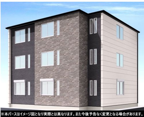
※本パースはイメージ図となり実際とは異なります。また今後予告なく変更となる場合があります。