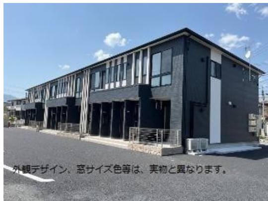
外観デザイン、窓サイズ色等は、実物と異なります。